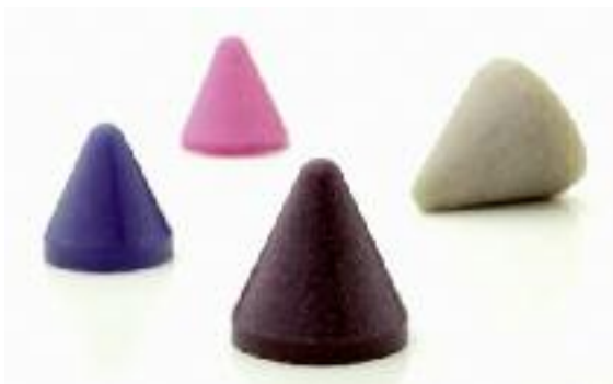
Kegel in verschiedenen Größen und Abrasivitäten

Die Form des Schleifkörpers muss so ausgewählt werden, dass alle Ecken und Konturen des Werkstückes erreicht werden, ohne dass diese sich darin verklemmen.