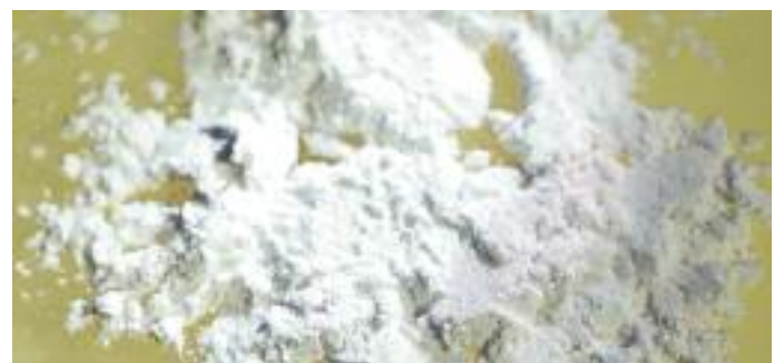
Entfettungspulver K 5