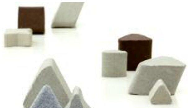
Auswahl an Keramik-Schleifkörpern