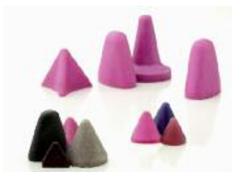
Auswahl an Kunststoff-Schleifkörpern